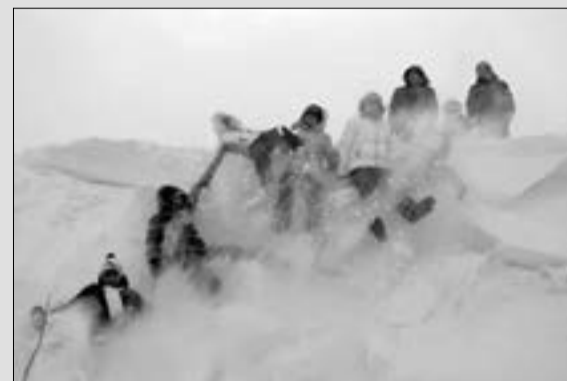
А ПОТОМ ВСЕ ДРУЖНО, ВЗЯВШИСЬ ЗА РУКИ, ЛЕТЕЛИ ВНИЗ, СБИВАЯ НОГАМИ ОГРОМНЫЕ СНЕЖНЫЕ ГРЕБНИ...