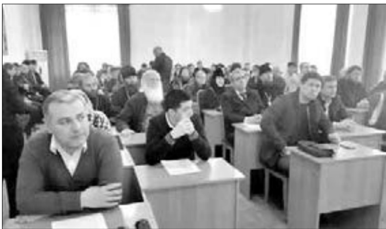
ПРЕДСТАВИТЕЛИ КОНФЕССИЙ НА СЕМИНАРЕ

В частности, были даны подробные разъяснения о сути миссионерства и прозелитизма, о которых говорится в Законе Республики Узбекистан «О свободе совести и религиозных организациях», об их негативном влиянии в деле укрепления межрелигиозного и международного согласия. Также речь шла и о вопросах религиозной литературы, а именно о постановлении Кабинета Министров республики «О мерах по совершенствованию порядка осуществления деятельности в сфере изготовления, ввоза и распространения материалов религиозного содержания», принятом в прошлом году.