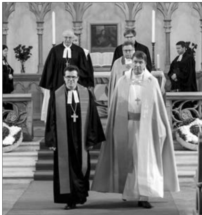
ТОРЖЕСТВЕННЫЙ ВЫХОД В КОНЦЕ БОГОСЛУЖЕНИЯ. В ПЕРВОМ РЯДУ СЛЕВА НАПРАВО: АРХИЕПИСКОП ДИТРИХ БРАУЭР, АРХИЕПИСКОП УРМАС ВИИЛМА

Приветствия прозвучали и от представителей Римско-Католической Церкви, евангельских Церквей, посольства Германии и США, правительства Санкт-Петербурга, Международ-