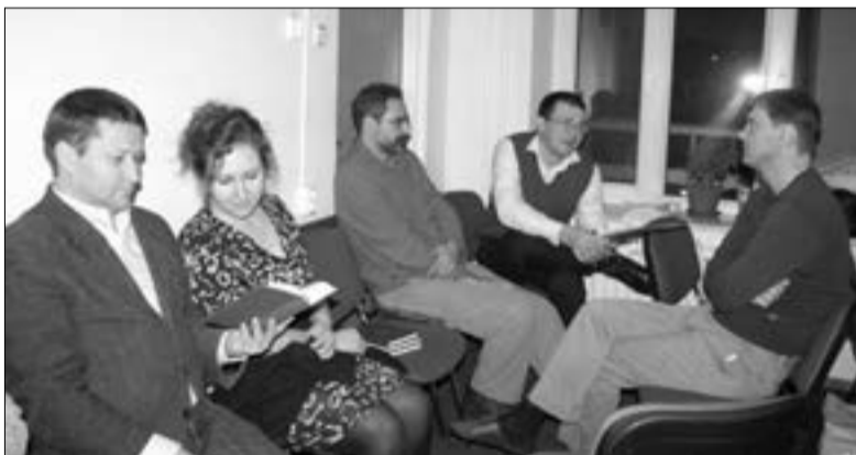
БИБЛЕЙСКАЯ РАБОТА В ГРУППАХ

Как большое полотно, которое сложилось из кусочков мозаики – разных, но только вместе имеющих смысл – таким был этот Церковный день ЕЛЦ ЕР. ■