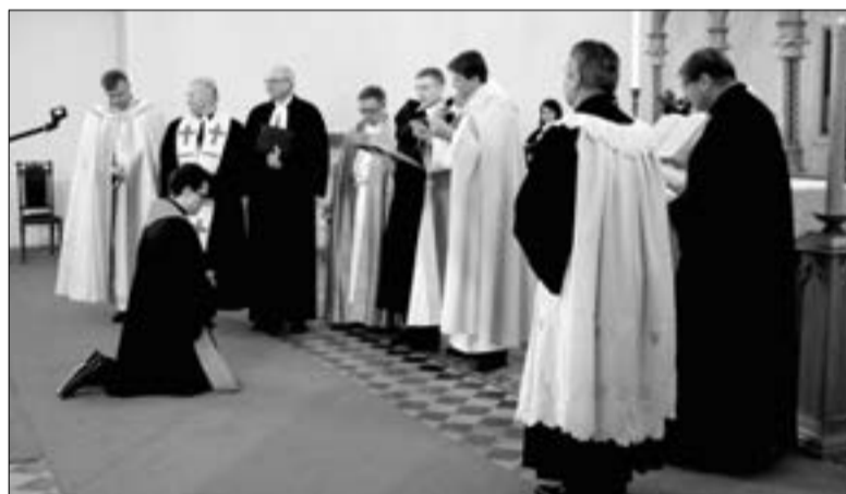
ПОСТАВЛЕНИЕ ДИТРИХА БРАУЭРА В АРХИЕПИСКОПЫ СОВЕРШИЛ АРХИЕПИСКОП УРМАС ВИИЛМА (ШЕСТОЙ СЛЕВА)

8 февраля на торжественном богослужении в должность Архиепископа Евангелическо-Лютеранской Церкви в России (ЕЛЦР) был введен епископ Евангелическо-Лютеранской Церкви Европейской части России (ЕЛЦ ЕР) Дитрих Брауэр. Гене-