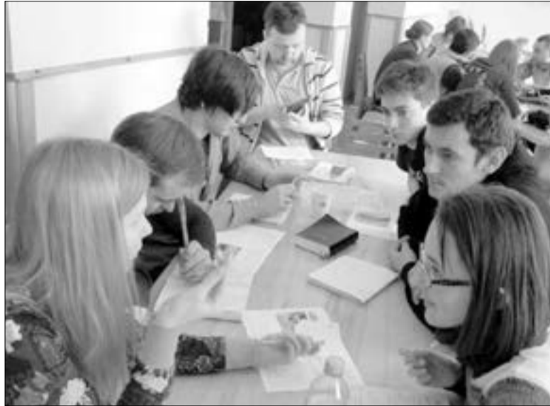
НА КОНФЕРЕНЦИЮ СЪЕХАЛАСЯ МОЛОДЕЖЬ ИЗ ОБЩИН НЕЛЦУ КИЕВА, ДНЕПРОПЕТРОВСКА, ОДЕССЫ, БЕРДЯНСКА, ЛЬВОВА, А ТАКЖЕ ДРУЗЬЯ ИЗ РЕФОРМАТСКОЙ ЦЕРКВИ