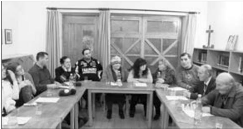
ВЕЧЕРНИЕ ЗАНЯТИЯ НА СЕМИНАРЕ

«Нерешенная задача». Продолжение. Начало на с. 1