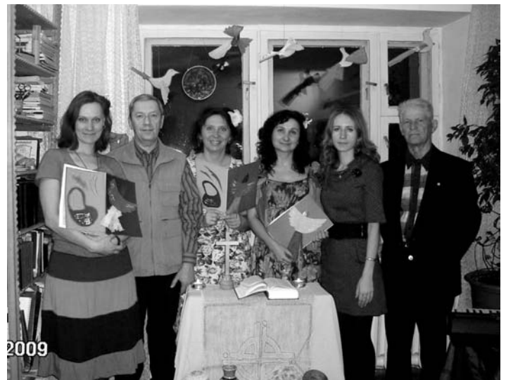
ХАБАРОВЧАНЕ ПЕРВЫМИ ЗАЖИГАЮТ СВЕЧУ МОЛИТВЫ

ХАБАРОВСК. Вот уже в десятый раз в общине святого Иоанна отпраздновали Всемирный день молитвы. В этом году, как и во все предыдущие, подготовительные встречи в кругу общины сделали незнакомую страну намного ближе. Без информации о повседневной жизни жителей Папуа-Новой Гвинеи, особенностях истории и климата трудно представить себе то, что волнует наших сестер и братьев в южном полушарии. Однако холодная дальневосточная весна не смогла остудить горячее желание поддержать в молитве тех, кто един с нами во Христе. Хабаровчане одними из первых в мире зажгли свечи Всемирного дня молитвы. Давняя традиция общины ставить горящие свечи вокруг глобуса – земного шара – делает всемирный размах движения зримым, каждый ощущает свою сопричастность, важность и единство со всеми христианами. Богослужение на час перенесло всех собравшихся на острова в Тихом океане, с их красками, запахами, заботами и надеждами. Вкусить южные плоды прихожане смогли на праздничном чаепитии после богослужения. Диск с зажигательной музыкой из Папуа-Новой Гвинеи стал очень популярен среди прихожан.