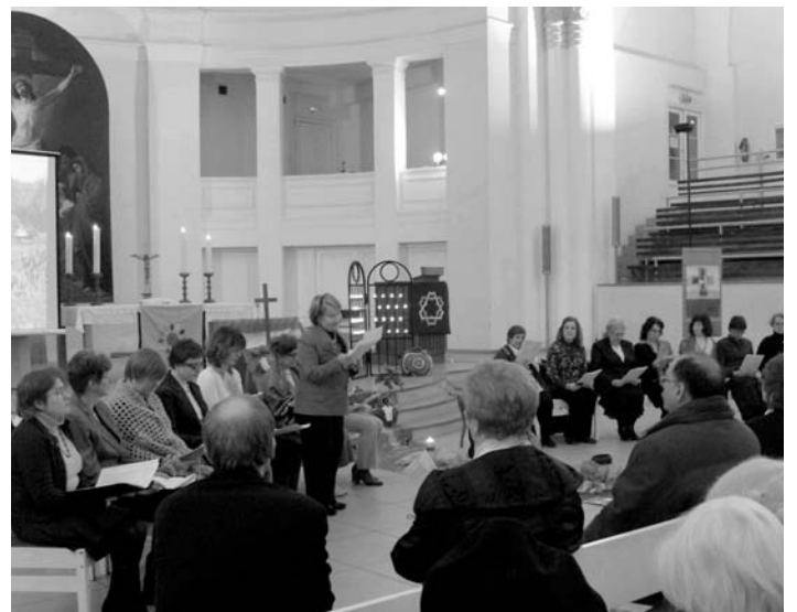
ВДМ ПРАЗДНОВАЛИ В ПЕТЕРБУРГЕ В ПЯТНАДЦАТЫЙ РАЗ

САНКТ-ПЕТЕРБУРГ. В этом году Всемирный день молитвы праздновали в Санкт-Петербурге в пятнадцатый раз! За прошедшие годы здесь сложилась крепкая подготовительная группа ВДМ из представительниц разных Церквей: православной, католической, лютеранской, баптистской и методистской. Вместе с тем, именно в последние годы число активных участниц заметно пополнилось молодыми христианками, увлеченными многообразием и яркостью всемирного молитвенного движения. К традициям ВДМ в Санкт-Петербурге относится и непременно проведение подготовительного семинара, для участия в котором приезжают также представительницы общины ЕЛЦ из Великого Новгорода.