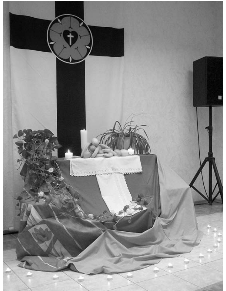
ОСВЯЩЕНИЕ ПОМЕЩЕНИЯ ПРИХОДА ХРИСТА СПАСИТЕЛЯ В НОВОСИБИРСКЕ 22 МАРТА ВСЕМИРНЫЙ ДЕНЬ МОЛИТВЫ В КРАСНОТУРЬИНСКЕ 6 МАРТА