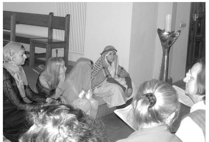
ЭКУМЕНИЧЕСКАЯ ГРУППА КИЕВА ИНСЦЕНИРОВАЛА СЮЖЕТЫ ИЗ БИБЛИИ

ления Украинской ассоциации религиозной свободы. В Львове под сводами армянского апостольского кафедрального собора собрались верующие православного вероисповедания, греко-католики, протестантская община «Гефсимания», представительницы христианского экуменического движения «Фокуляре». Как всегда, женщины Харькова, Днепропетровска и Винницы с особой любовью и мудростью подготовили и провели этот день. Экуменическая группа Киева совместно с детским и певческим кружком, солистами церковного хора молилась, пела, читала слово Божье, инсценировала сюжеты