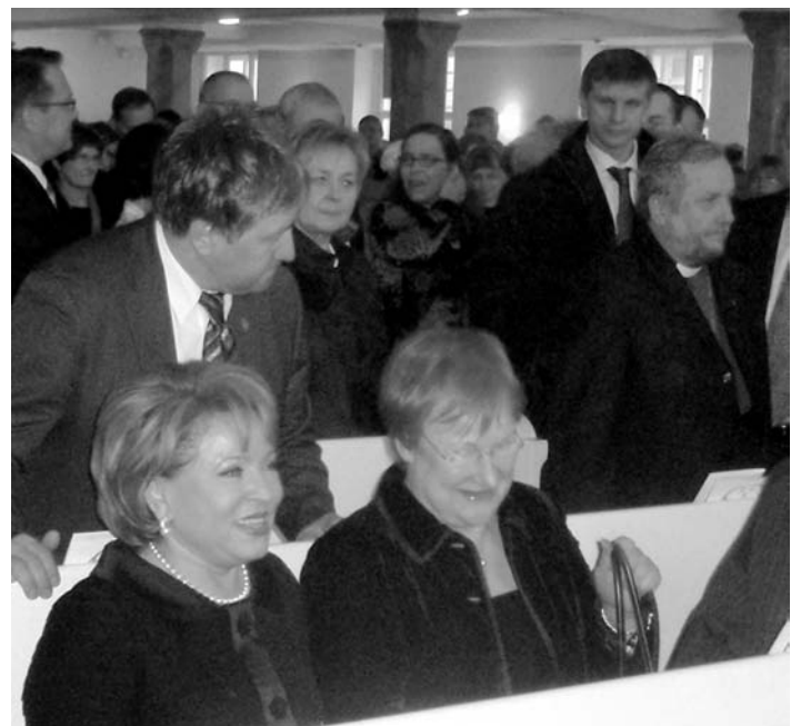
ВАЛЕНТИНА МАТВИЕНКО, ТАРЬЯ ХАЛОНЕН И АРРИ КУГАППИ НА ТОРЖЕСТВЕ

В программе юбилейного года множество событий, о них мы будем рассказывать в наших последующих публикациях. Одним из ближайших планируемых событий является Пасхальный концерт Финского музыкального института в церкви св. Марии, который состоится 8 апреля. В программе – «Stabat Mater» Перголези. А 9 апреля – День Микаэля Агриколы – день финского языка проводит Институт Финляндии в Санкт-Петербурге.