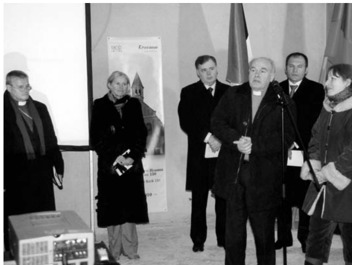
НА ПРИЕМЕ С ПРИВЕТСТВЕННЫМ СЛОВОМ ВЫСТУПИЛ АРХИЕПИСКОП ЕЛЦ ЭДМУНД РАТЦ

Мы будем с нетерпением ожидать того момента, когда можно будет опубликовать новый материал о празднике в уже возродленном здании. Открытие церкви св. Иоанна запланировано на 27 ноября 2010 года – к ее 150-летию юбилею.