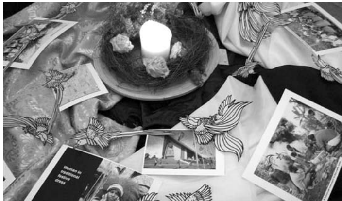
КРАСИВЫЕ ДЕКОРАЦИИ К МОЛИТВЕ

Христе. Импульсы и примеры из жизни женщин из Папуа-Новой Гвинеи, которые в этом году подготовили литургию Всемирного дня молитвы, помогли увидеть общее в радости и горе и приблизиться к образу тела Христова. Мы надеемся на продолжение этой традиции в нашей общине.