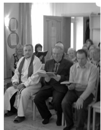
БОГОСЛУЖЕНИЕ ПО ОКОНЧАНИИ СЕМИНАРА

кументация. Все эти темы были широко и интересно раскрыты. Лекция юриста омского прихода раскрыла соотношения Конституции РФ (2 глава, ст. 28 и далее), гражданского кодекса и некоторых федеральных законов, относящихся к нашей непосредственной деятельности. Интересным было выслушать комментарии к книге Неемии, подготовленные пастором Лаппалайненем, особенно уместные на этом семинаре. У Неемии, как руководителя, нам можно учиться молитве, действиям, планированию и примеру поведения. Когда Неемия ▶ с. 2