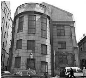
ТАК ВЫГЛЯДИТ ЦЕРКОВЬ СВ. ИОАННА СЕГОДНЯ

не удалось избежать и эстонской церкви св. Иоанна, построенной в Петербурге полтора века назад. Самостоятельный эстонский приход св. Иоанна образовался в тогдашней столице еще в 1842 году. 27 ноября 1860 года состоялось торжественное освящение церкви св. Иоанна, построенной в неоромантическом стиле. Над зданием возвышалась позолоченная башня с крестом, новая церковь вмещала 2000 человек, мест для сидения было 800. Рядом располагался дом прихода, где находились квартиры пастора, его помощника и кюстера, а также эстонская школа и приют для бедных. К началу XX века количество прихожан сильно возросло и достигало уже 22 тыс. человек. В 1930 году церковь была закрыта, здание перестроено и передано сначала под клуб, а затем долгие годы в нем размещался строительный трест. Спустя более 60 лет, в 1995 году, когда страна переживала духовное возрождение, в Санкт-Петербурге была официально зарегистрирована Эстонская евангелиско-лютеранская община св. Иоанна. Здание общине передали уже через два года после этого события. Но потребовалось более десяти лет на то, чтобы появилась возможность восстановить его первоначальный облик. Но, несмотря на это, духовная жизнь в церкви св. Иоанна возоб-