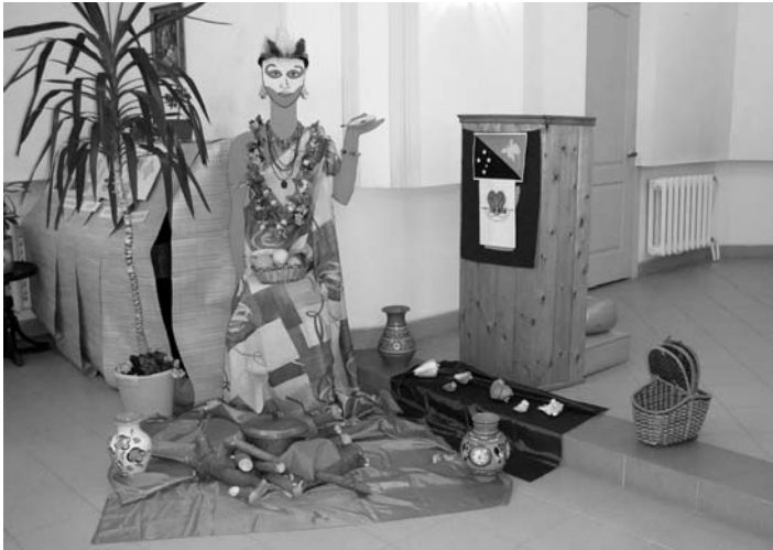
СИМВОЛЫ ПАПУА-НОВОЙ ГВИНЕИ В ОБЩИНЕ ПЕРМИ

Всемирный день молитвы община начала праздновать еще в 1999 году, вначале богослужение проводилось только на немецком языке. В последние шесть лет к нам присоединилась община Римско-католической церкви, чтобы вместе молиться с христианками других стран. Богослужение 7 марта даровало нам удивительное ощущение единения с христианками Папуа-Новой Гвинеи и всего мира.