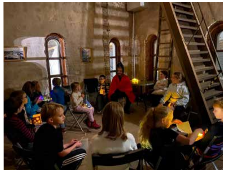
Община св. Анны и св. Петра, Санкт-Петербург.