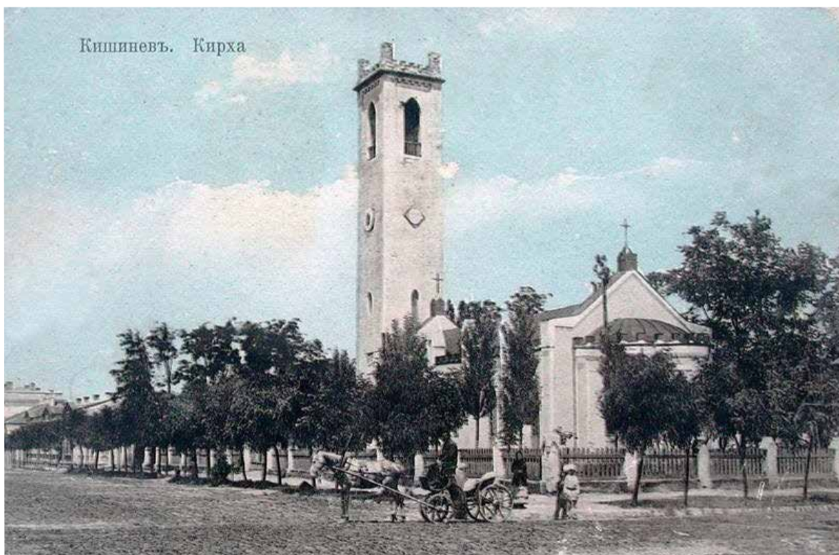
Историческое задние лютеранской церкви в Кишинёве. Не сохранилось.

(По материалам „Lutherischer Dienst“ 2/2024)