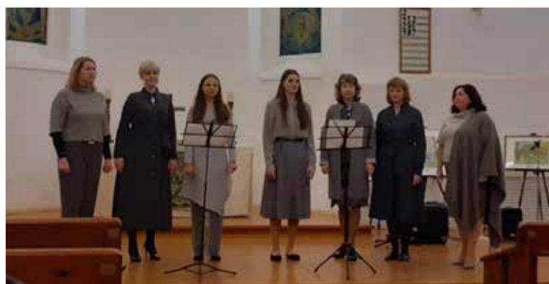
Первый концерт проекта в церкви св. Марии.