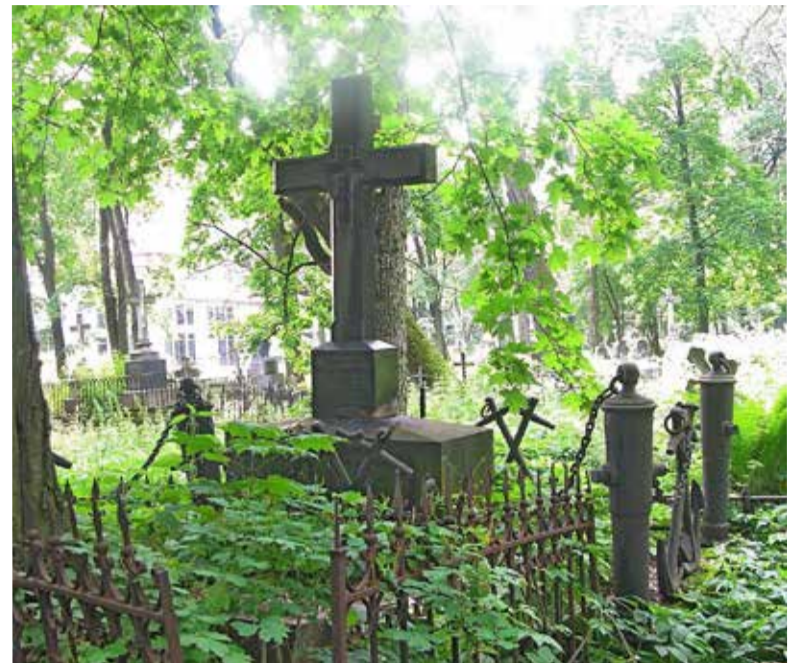
Склеп семейства Анжу на Смоленском лютеранском кладбище.