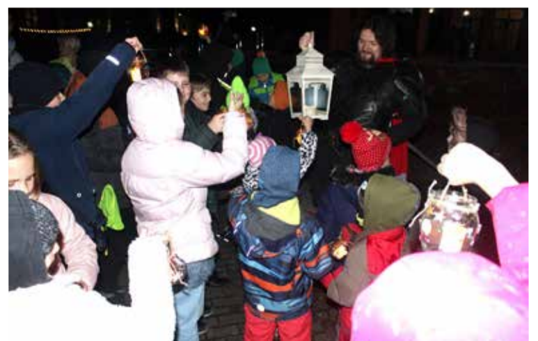
Община церкви Воскресения, Калининград. При участии Культурно-делового центра российских немцев в Калининграде.