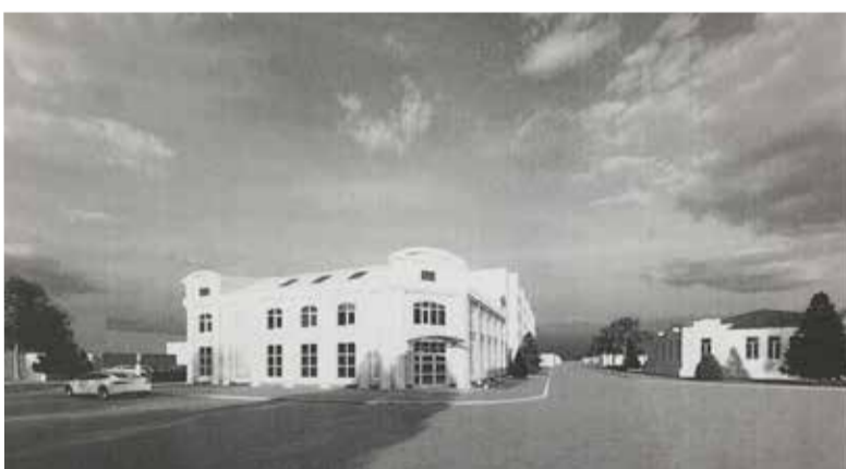
Так будет выглядеть дом общины.