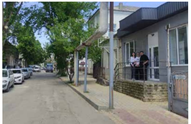
Дом общины в Бельцах.

хентаге евангелических Церквей Центральной и Восточной Европы во Франкфурте-на-Одере в июне 2024 года и представить работу ЛЦАИ РМ.