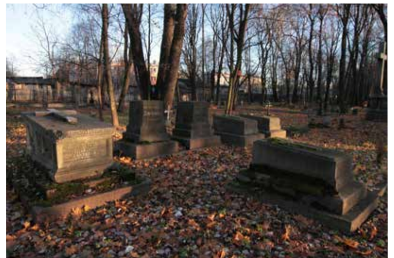
Захоронения Ламбсдорфов (Ламсдорфов) на Смоленском лютеранском кладбище.

я запомнила ощущение steepности и достоинства. Часто мы с братом разглядывали могилы и размышляли о том, как прожили усопшие свои жизни, – поделилась она своими воспоминаниями. – И я, уже взрослый человек, продолжаю делать это и сегодня, когда посещаю кладбище. Поэтому кладбище являются для меня важным местом. Они напоминают о людях, которые покинули этот мир. Я также думаю о людях, которые в нашем мире приняли насильственную смерть. К сожа-