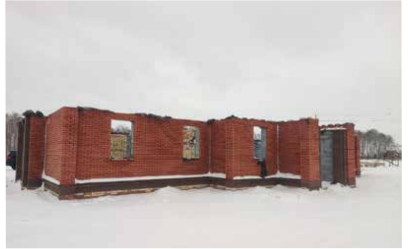
Ход строительства церкви на начало ноября этого года.

Так как храм строится не на одно столетие, важен очень серьезный