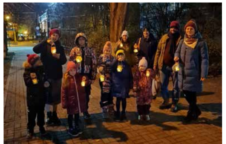
Община церкви св. Марии, Воронеж.