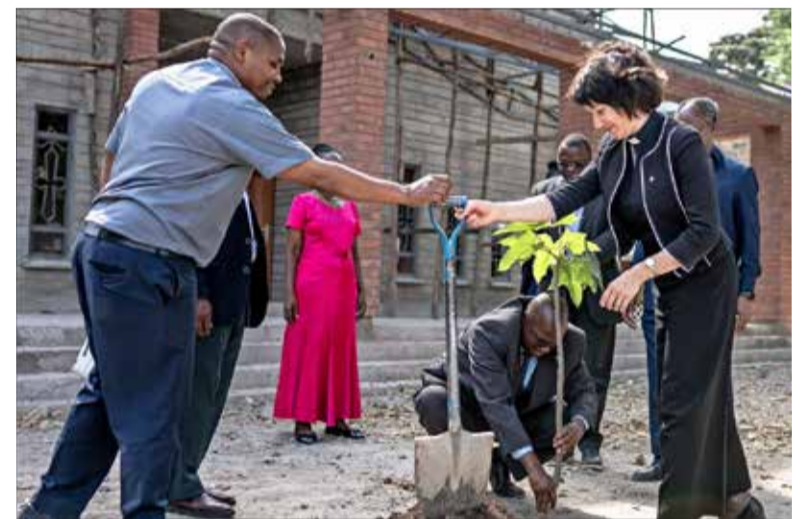
Генеральный секретарь ВЛФ, пастор д-р Анне Бургхардт сажает дерево рядом с главным офисом Кенийской Евангелическо-Лютеранской Церкви в Найроби.

Пастор д-р Анне Бургхардт, генеральный секретарь ВЛФ