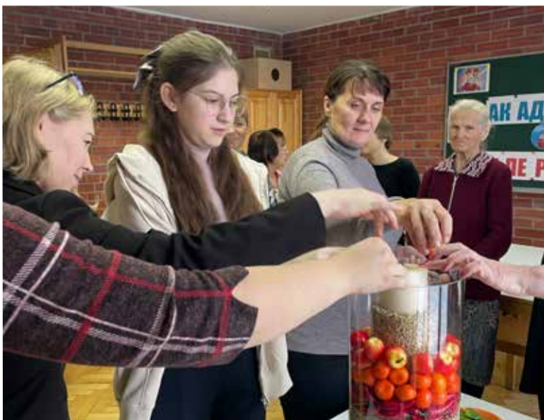
В ретрите приняли участие прихожанки общин Омска и Омской области.

ОМСК. 23 ноября в церкви Христа прошел женский ретрит «Там и я буду жить» (Руфь 1,16) для прихожанок общин Омска и Омской области.