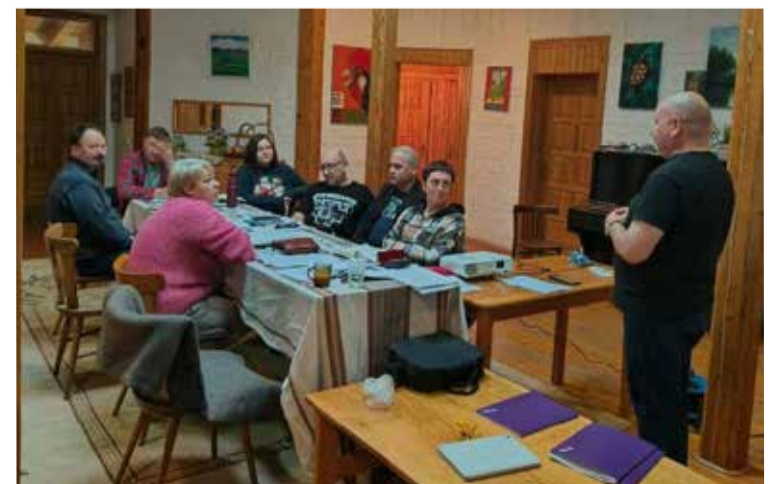
На занятиях семинара.