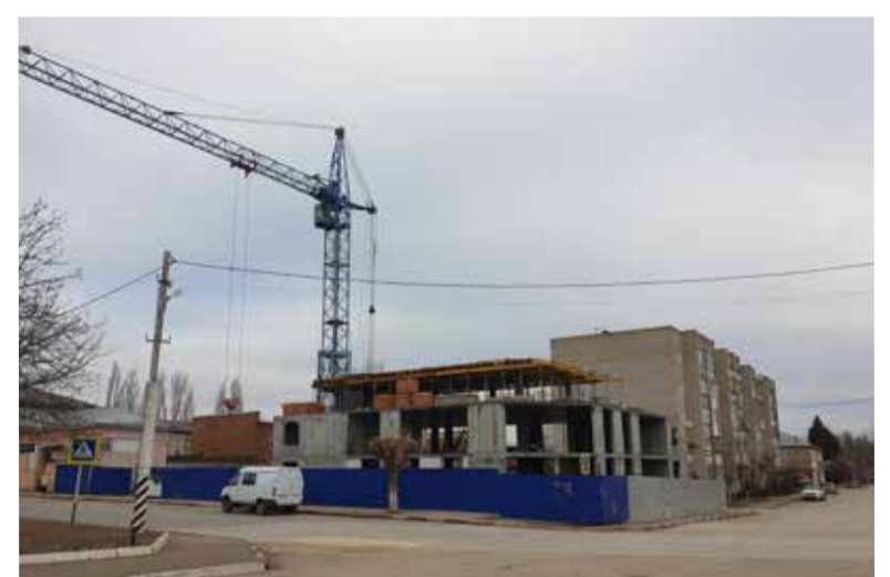
Дом общины строится рядом с церковью св. Троицы.