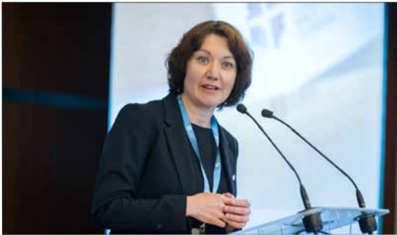
Генеральный секретарь ВЛФ, пастор д-р Анне Бургхардт.