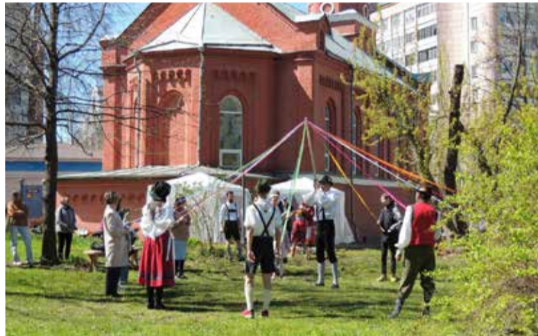
Праздник с играми, танцами и песнями продолжился в церковном саду, где к общине присоединились члены общества немцев „Wiedergeburt“ и молодежь из католической церкви.