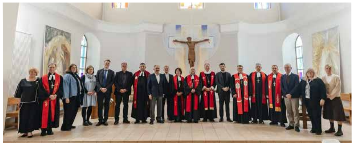
Богослужению в церкви св. Екатерины в Киеве прошло с участием гостей из ВЛФ, а также служителей НЕЛЦУ и председателей общин.