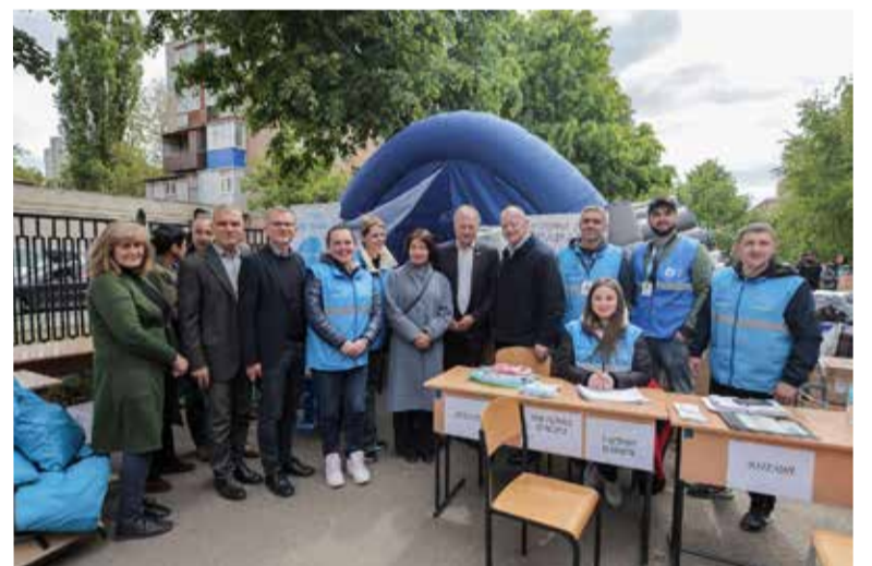
Делегация ВЛФ в Харькове с сотрудниками страновой программы ВЛФ, работающей в городе.

кресты висят в кабинетах многих руководителей лютеранских Церквей по всему миру.