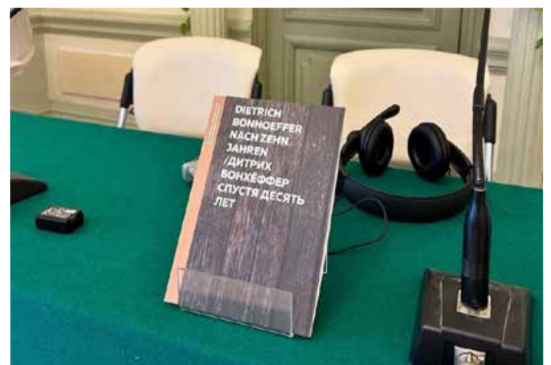
Заметки Дитриха Бонхёффера «Спустя десять лет» на русском впервые вышли отдельной книгой.