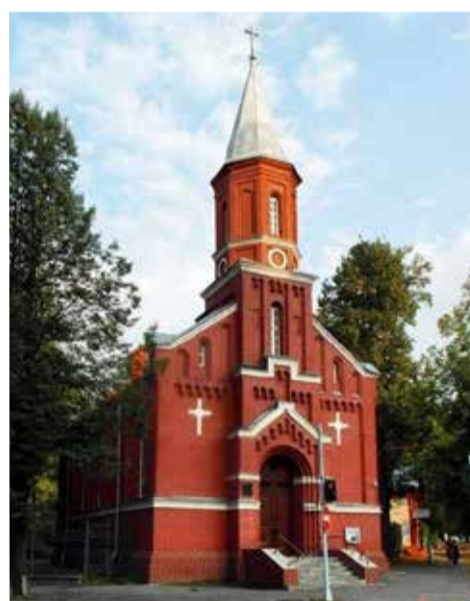
Церковь св. Марии в Перми.