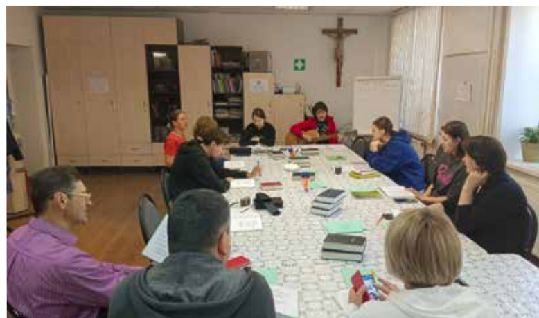
На семинар собрались участники из Москвы, Саратова, Самары, Ульяновска и Калининграда.

Для закрепления полученных знаний и умений все участники были приглашены принять участие в христианских семейных встречах 8–15 августа этого года на территории Саратовского пропства на живописном берегу Волги. ■