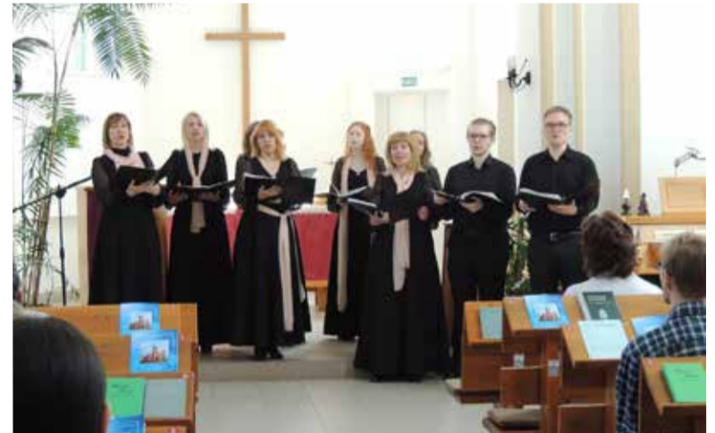
После богослужения всех ждал подарок от хора „Junge Stimmen“.