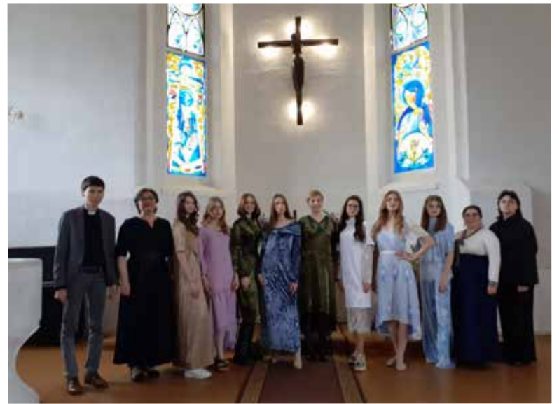
Завершил фестиваль показ коллекций христианской одежды.

Пожертвования, собранные на фестивале, пойдут на диаконическое служение общины.