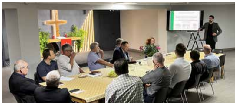
Главной темой встречи стало обсуждение концепции культурно-выставочного центра с тестовым названием «Компас веры».

По материалам сайта www.propstei-klg.com