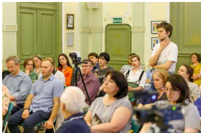
Участники презентации в Культурном центре «Покровские ворота».