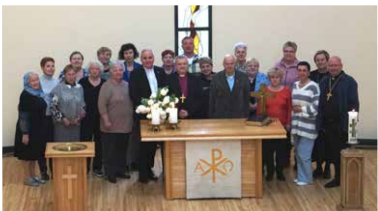
Участники заседаний Синода в церкви Воскресения.

КАЛИНИНГРАД. 10 мая в церкви Воскресения прошел очередной Синод Калининградского пропства.