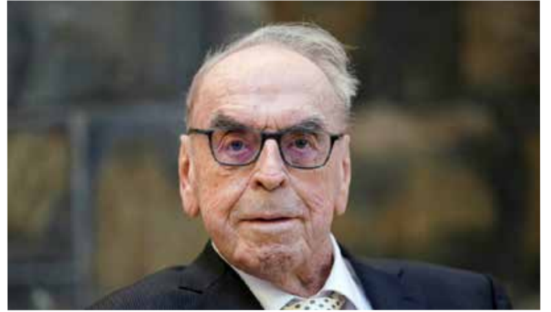
Юрген Мольтман (1926–2024).

Нынешний председатель Совета Евангелической Церкви в Герма-