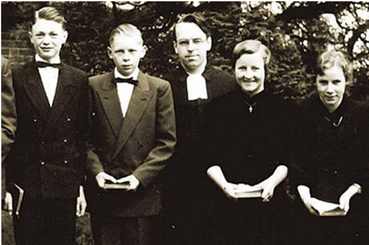
Юрген Мольтман (в центре) с молодежью своей церкви в Бремене (1954 год).